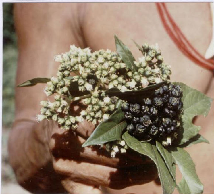
Die weiß blühenden Dolden tragen zugleich dunkelgrüne bis schwarze Früchte.