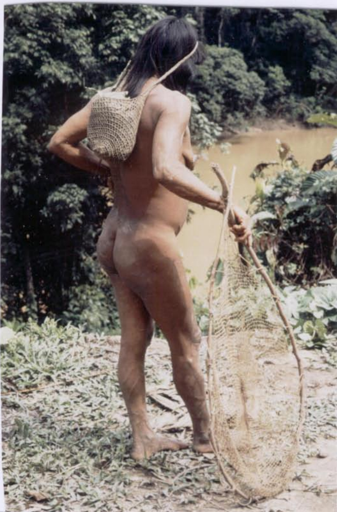
Miñemu mit Barbasco- Gemisch und Netz auf dem Weg zum Fluß.