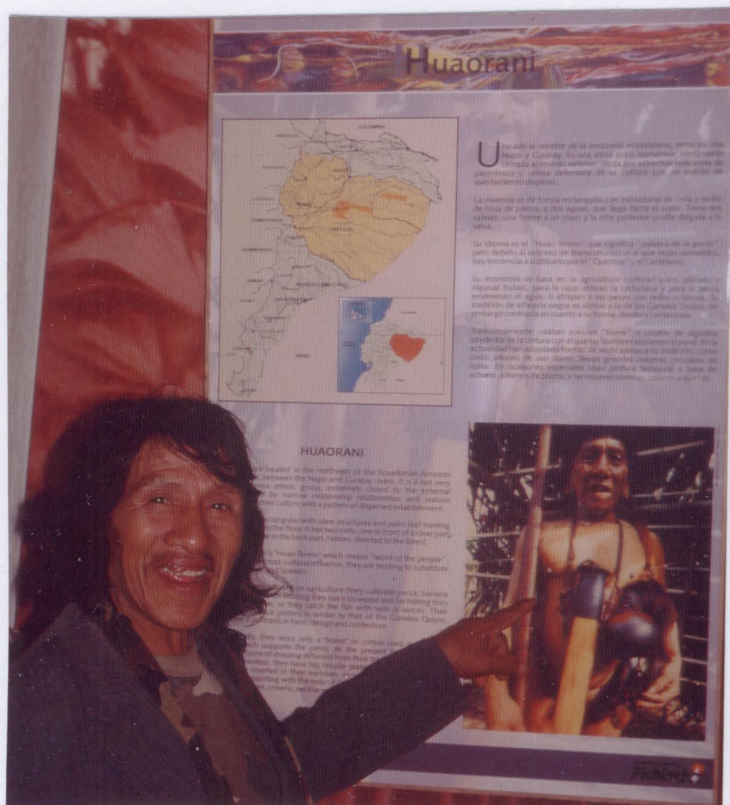
Äquator- Denkmal: Dabo im Museum

Da, wo Dabo wohnt, befindet sich die Zufahrt zur kanadischen Ölkompanie „INCANA“, die sich immer weiter im Nationalpark Yasuni ausbreitet. Der Ort ist nach Dabo benannt. „Vorher hatten wir Probleme mit den Kolonisten und sind deshalb nach hier gezogen“.