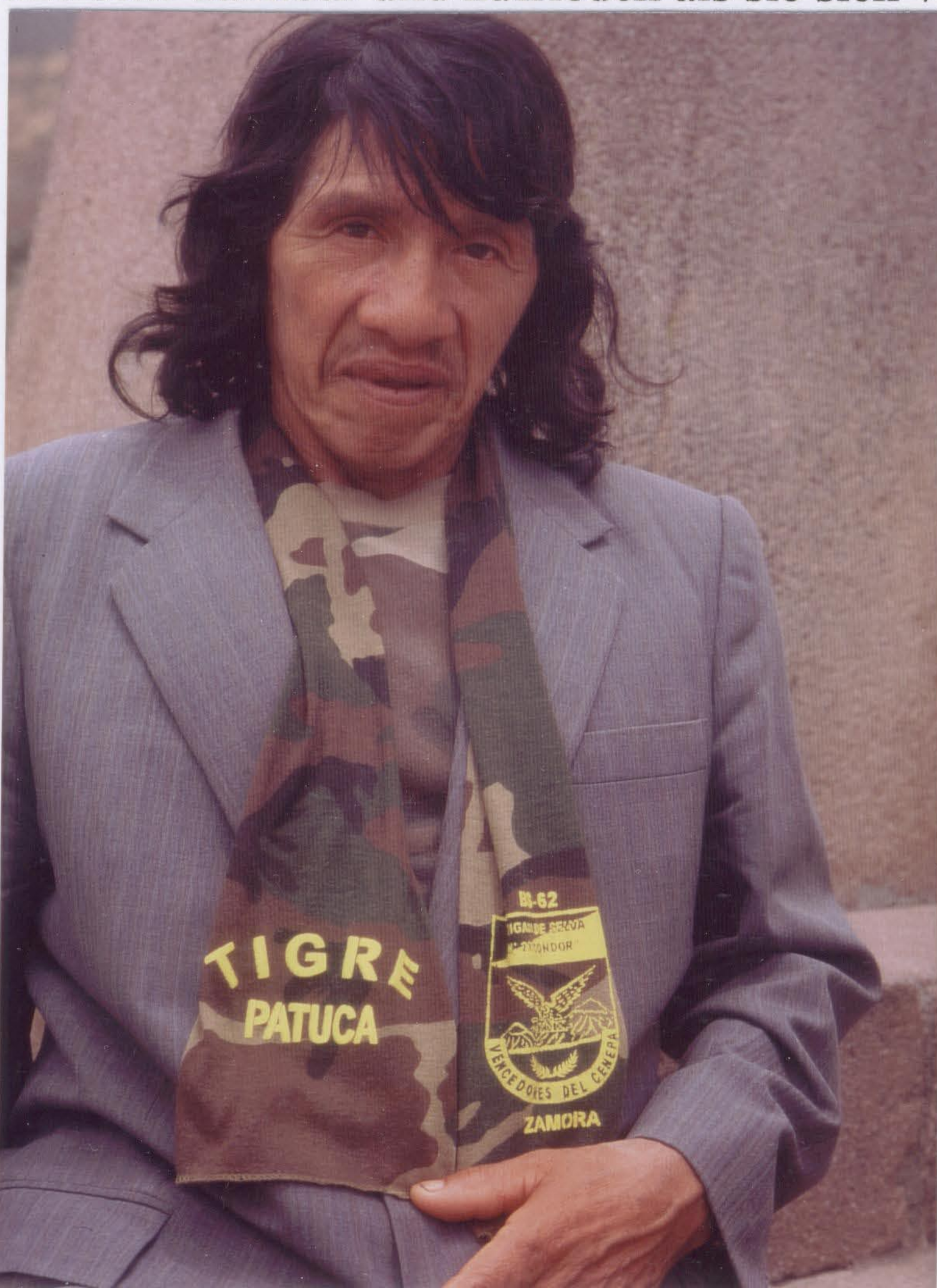
Dabo ist stolz auf sein Halstuch.

Vater mußte ihnen das Blasrohr und die Lanzen zeigen, die er von seinem letzten Überfall mitbrachte. Es wurde viel fotografiert. Sie waren alle sehr dankbar und zufrieden als sie sich verabschiedeten.