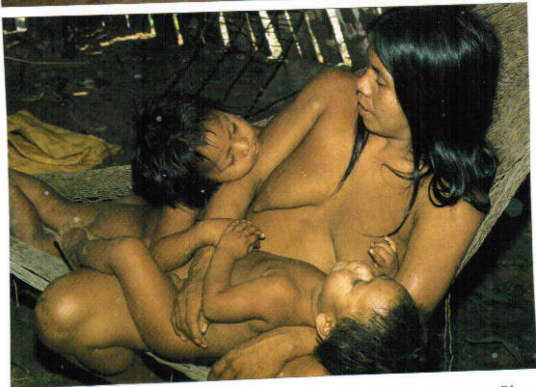
Alle Hängematten sind so niedrig angebracht, daß sie auch zum Sitzen bequem sind; die einzige Sitzgelegenheit in der Huaorani- Hütte.